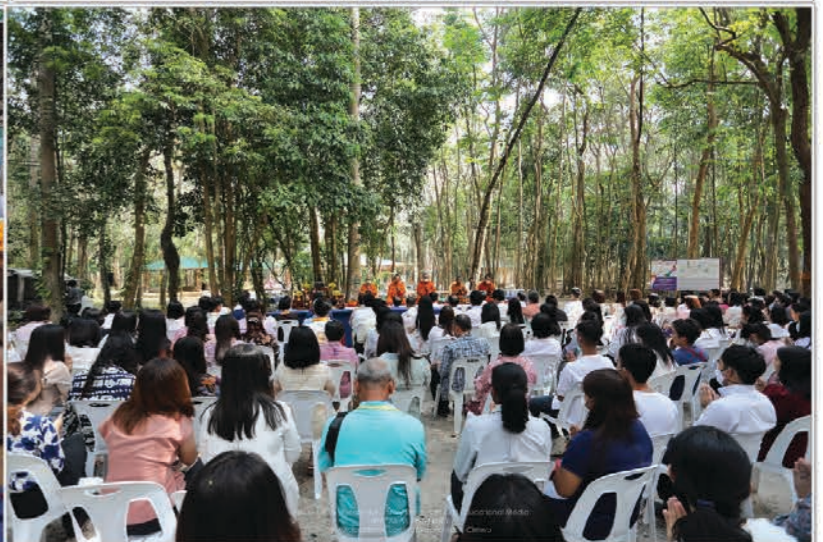
ทำบุญทอดตมปิงประจำ 2564