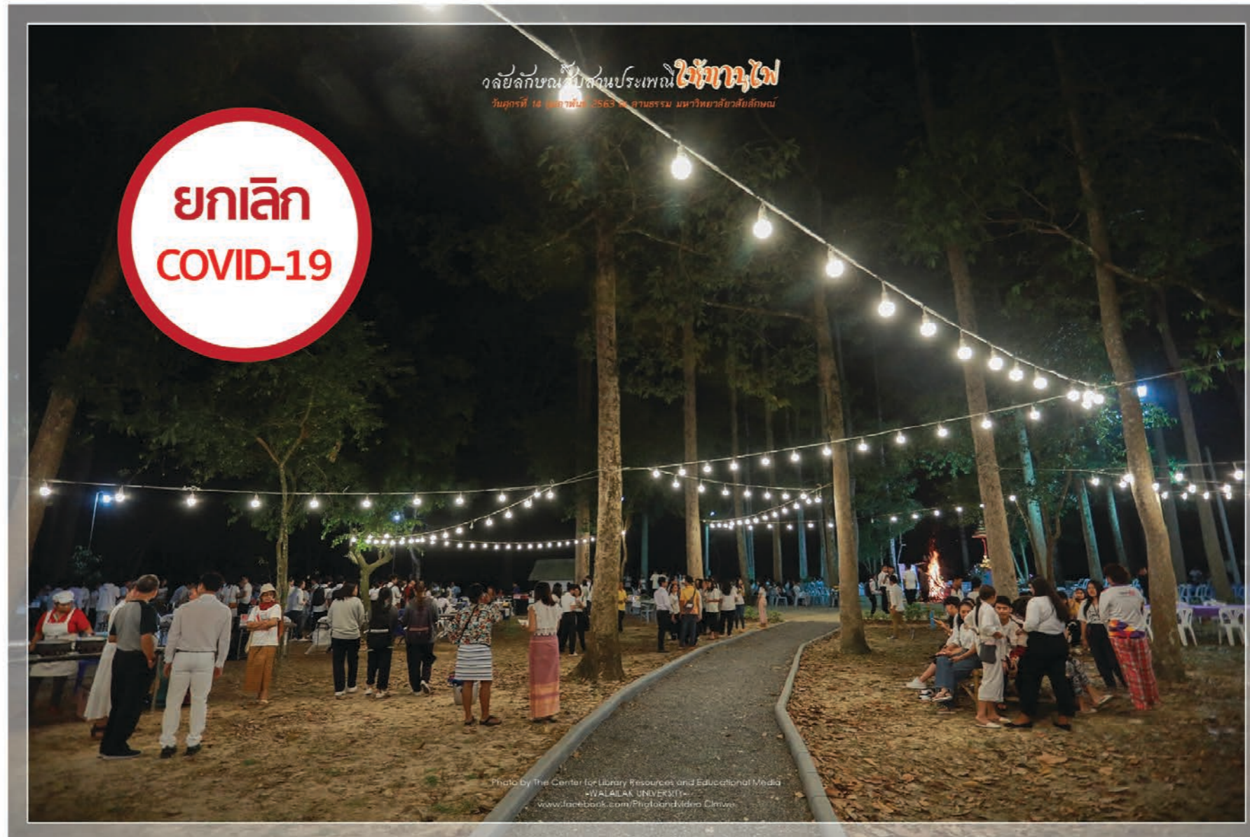
อาคารวัฒนธรรมวิทยาลัยชุมชน

งานสืบสานประเพณี "บุญให้ทานไฟ" ยกเลิกการจัดกิจกรรมเนื่องจากสถานการณ์การแพร่ระบาดของโรค Covid-19