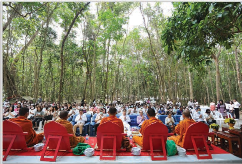
ทำบุญทอดตมปิงประจำ 2564