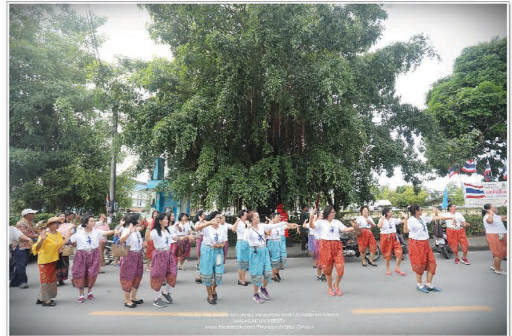
๙ ตุลาคม พ.ศ. ๒๕๖๓ งานทอดกฐิน ณ วัดเสนาราม อ.ท่าศาลา จ.นครศรีธรรมราช