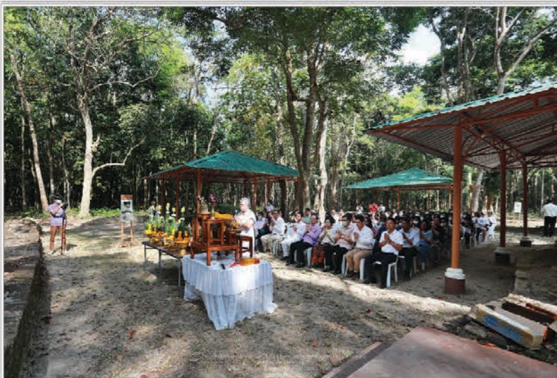
ทำบุญทอดตมปิงประจำ 2564