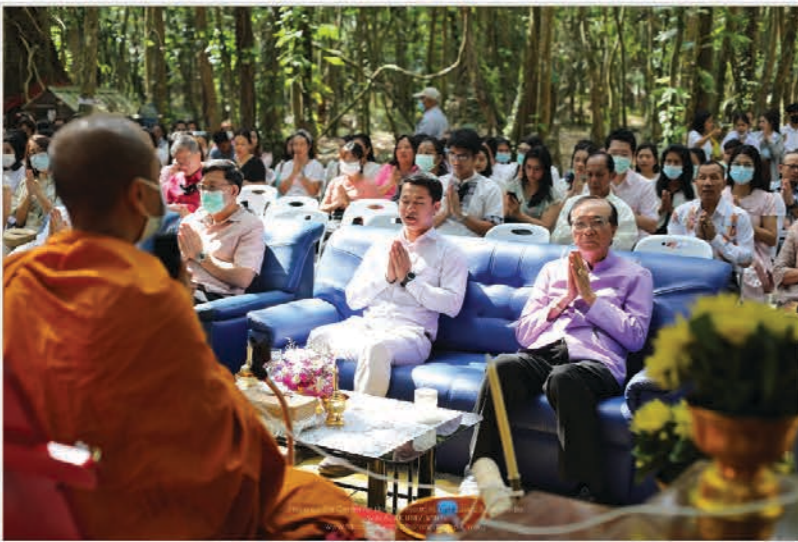
ทำบุญทอดตมปิงประจำ 2564

ทำบุญทอดตมปิงประจำ 2564 ผู้บริหาร บุคลากร บุคคลภายนอก และนักศึกษา เข้า ผู้เข้าร่วมกิจกรรมประมาณ 300 คน ร้อยละความพึงพอใจของผู้เข้าร่วมกิจกรรม คิดเป็น ร้อยละ 100