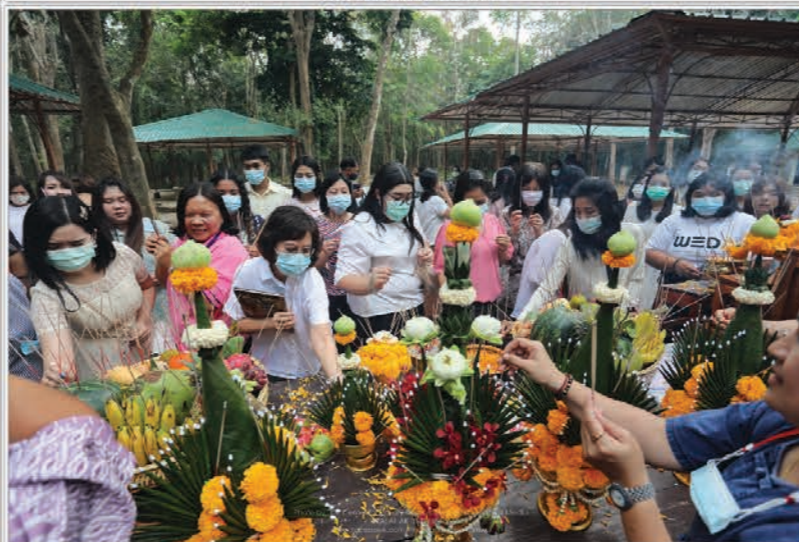
ทำบุญทอดตมปิงประจำ 2564