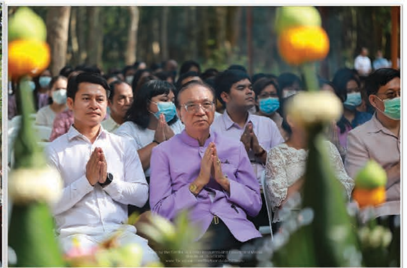
ทำบุญทอดตมปิงประจำ 2564