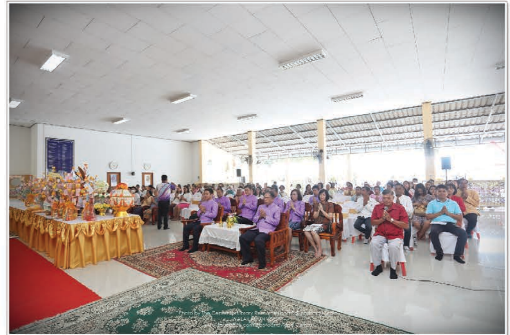
๙ ตุลาคม พ.ศ. ๒๕๖๓ งานทอดกฐิน ณ วัดเสนาราม อ.ท่าศาลา จ.นครศรีธรรมราช

เมื่อวันที่ 9 ตุลาคม 2563 มหาวิทยาลัยวลัยลักษณ์ ร่วมเป็นเจ้าภาพทอดกฐินสามัคคี เพื่อสมทบทุนเทพื้น คอนกรีตรอบอุโบสถและปรับปรุงระบบไฟฟ้า ณ วัดเสนาราม ตำบลท่าศาลา อำเภوتاศาลา จังหวัดนครศรีธรรมราช