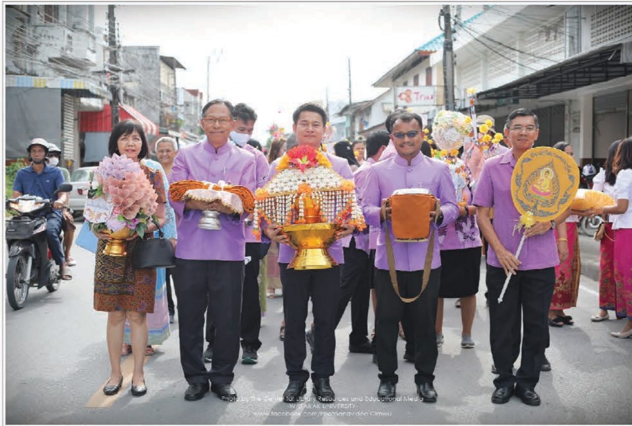
๙ ตุลาคม พ.ศ. ๒๕๖๓ งานทอดกฐิน ณ วัดเสนาราม อ.ท่าศาลา จ.นครศรีธรรมราช