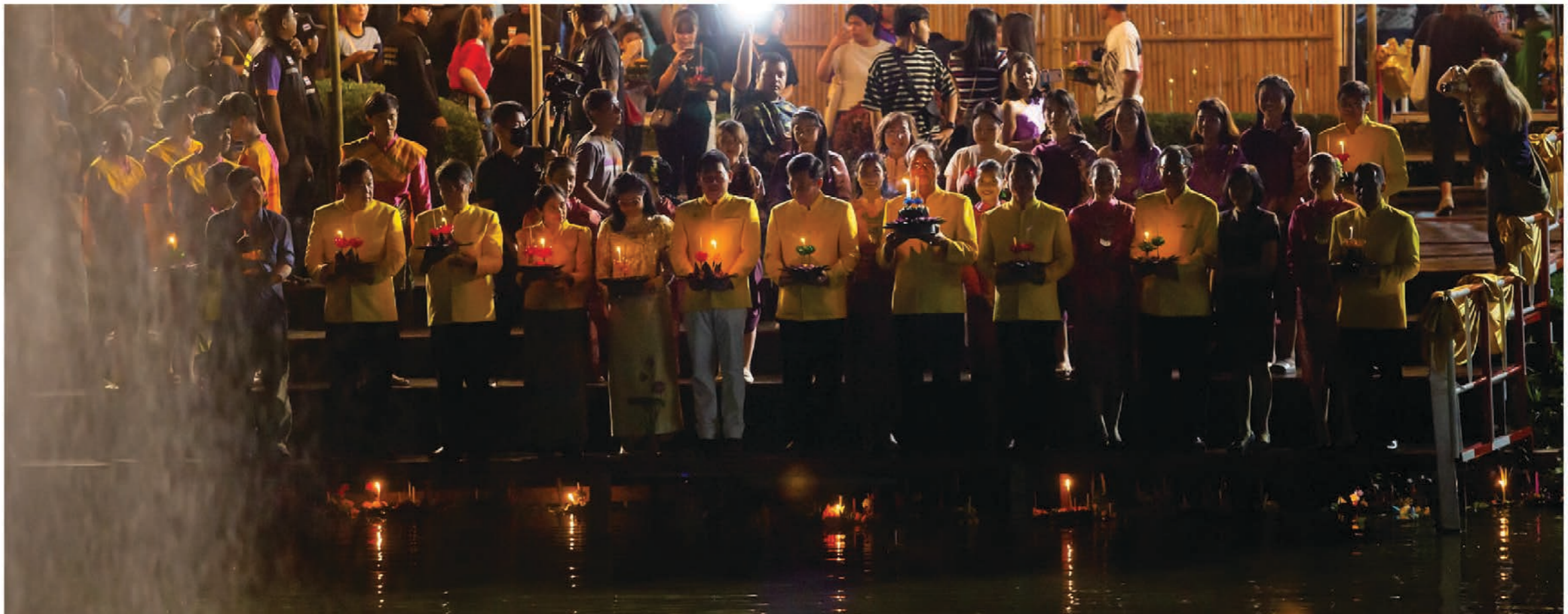
อาคารวัฒนธรรมวลัยลักษณ์

งานสืบสานประเพณี "วลัยลักษณ์ลอยกระทง เสริมส่งประเพณี สุวักีธรรมชาต" เมื่อวันที่ 31 ตุลาคม 2563 ได้รับการตอบรับจากผู้บริหาร บุคลากร และนักศึกษา รวมถึงบุคคลภายนอกเป็นอย่างดี มีผู้เข้าร่วมประกวดเทพีพามาศ ประเภทบุคลากร จำนวน 16 คน ประเภทนักศึกษา 17 คน และการประกวด Lady Boy จำนวน 6 คน มีร้านค้าร่วมจำหน่ายสินค้า กว่า 50 ร้าน และมีผู้เข้าร่วมงานมากกว่า 3,000 คน ร้อยละความพึงพอใจของผู้เข้าร่วมกิจกรรม คิดเป็นร้อยละ 90.5